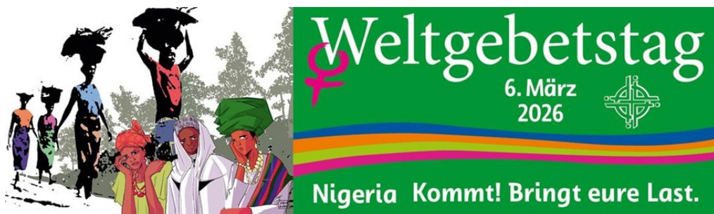
Abbildung: Weltgebetstag e.V.